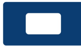
De 'P' vlag = 5 min. sein