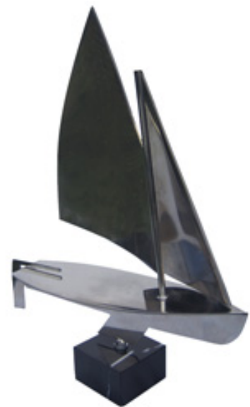
Hans Schriel Bokaal

Tegen het einde van ieder seizoen organiseren we het jaarlijkse evenement de 'Loef & Lij Regatta'. Dit is een gezellig evenement dat een hele dag duurt en het is een mooie gelegenheid om familie en vrienden kennis te laten maken met de activiteiten van de Vereniging. Deze wedstrijd met, afhankelijk van de weersomstandigheden 3 of 4 wedstrijden heeft een eigen klassement.